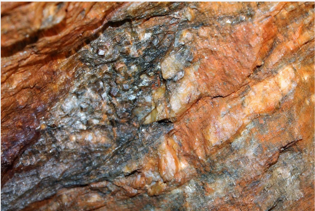
Granaty w szybie Leopold.