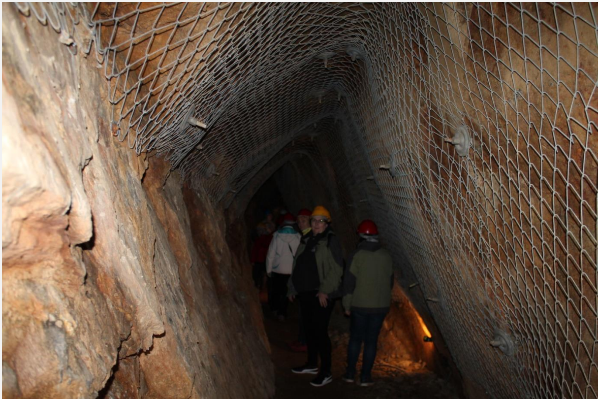
W szybie Św. Jana.