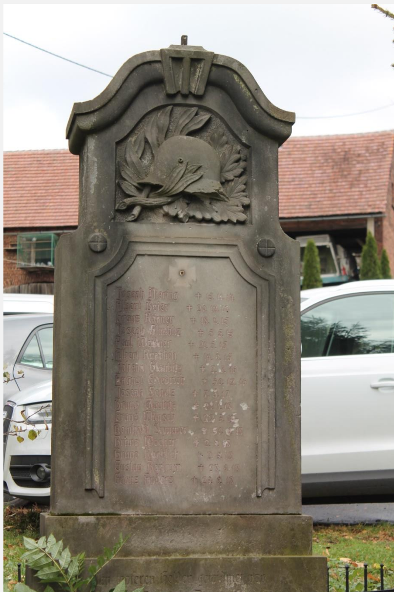
Pomnik żołnierzy niemieckich z I wojny światowej w Radoniowie.