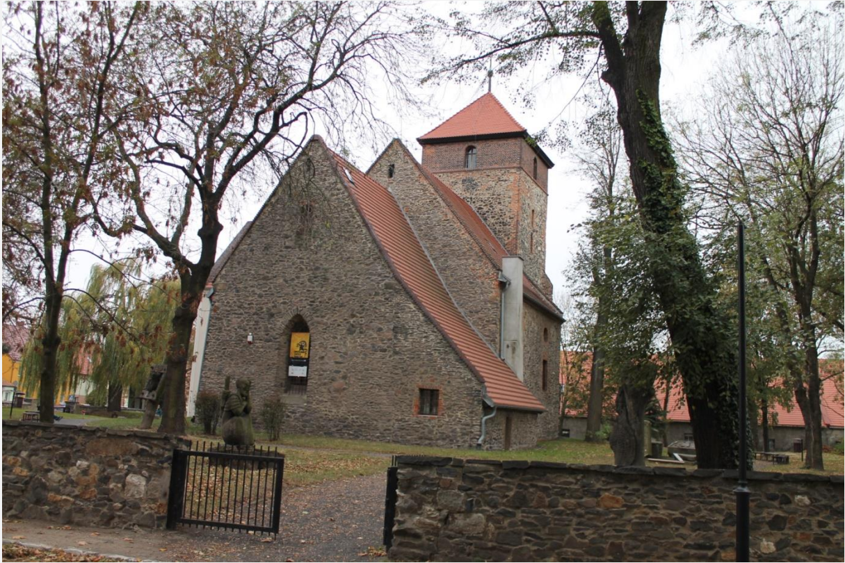
Muzeum Bitwy pod Legnicą (od 1961 roku) w dawnym kościele pw. Świętej Trójcy i Najświętszej Maryi Panny