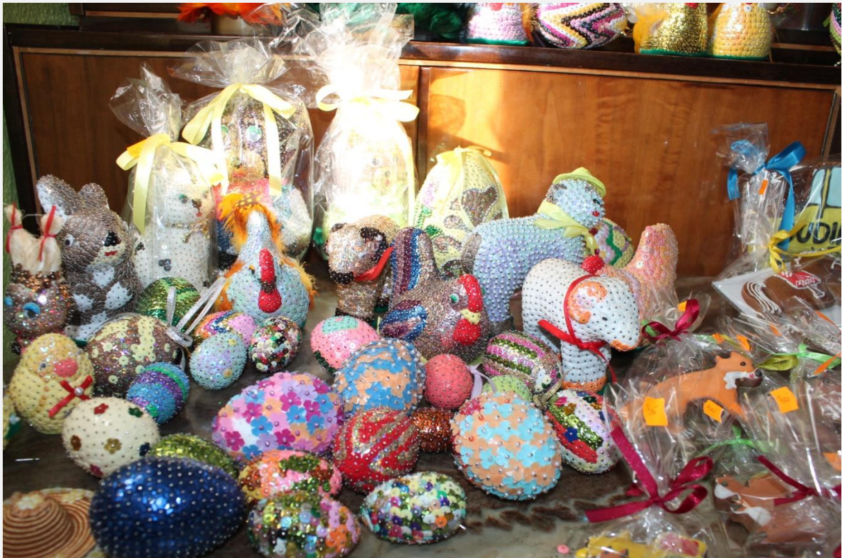
Wyroby twórczych ludowych z Radoniowa – pisanki, pierniczki, itd.