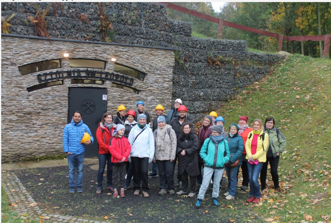
...przed wejściem głównym do kopalni.

Wycieczka rozpoczęła się od zwiedzania nowej atrakcji turystycznej Pogórza Izerskiego - Geoparku w miejscowości Krobica. Ofertą parku jest ścieżka turystyczno-dydaktyczna „Śladami dawnego górnictwa kruszców” składająca się z dwóch części, podziemnej 350 metrowej oraz nadziemnej 8 kilometrowej. Zwiedzanie rozpoczęliśmy od ekspozycji historycznych map i narzędzi w pomieszczeniu głównego wejścia, skąd wąskim korytarzem przeszliśmy do wyrobiska XVIII wiecznej sztolni Św. Leopold. Podczas przejścia mogliśmy zobaczyć łupki serycytowe z granatami, żyły kwarcu mlecznego oraz liczne wytrącenia związków żelaza nadające wyjątkowy koloryt korytarzom. Następnie przeszliśmy do położonej 10 metrów wyżej XVI wiecznej sztolni Św. Jan, gdzie można było zobaczyć pozostałości wyrobisk eksploatacyjnych rud cyny. Charakter trasy doskonale oddaje realia ciężkiej pracy w dawnej kopalni, ślady ręcznego wydobywania są wciąż widoczne, co sprawia, iż miejsce to jest wyjątkowe.