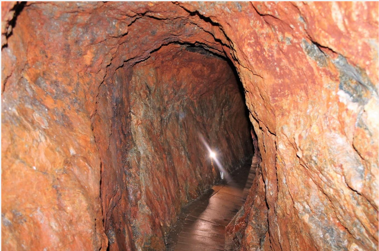
Sceneria szybu Św. Leopold.