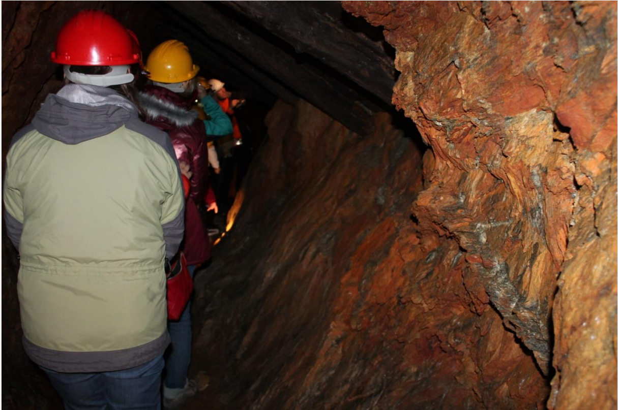
...w szybie Leopold.