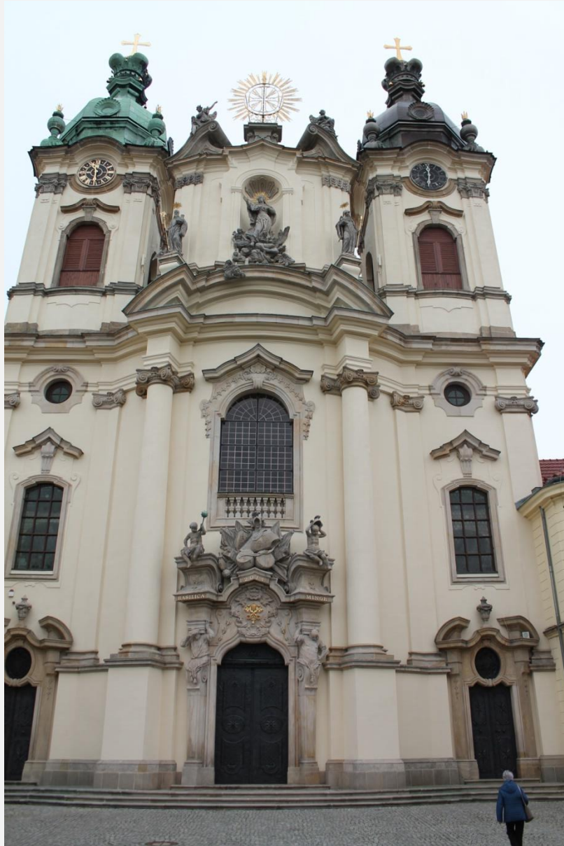
Fasada bazyliki mniejszej pw. Św. Jadwigi zbudowana w latach 1723-1726.